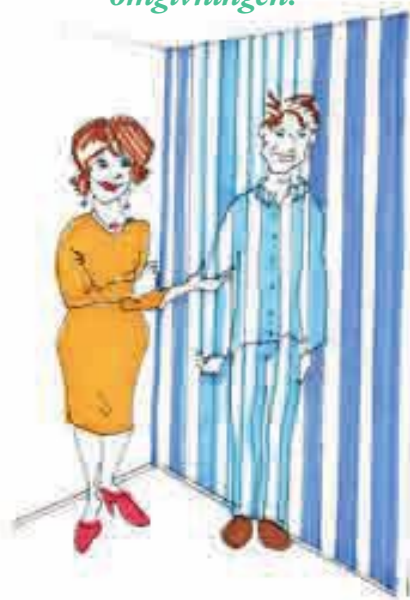
Illustration: Hilda Zollitsch

"Både patienten och medföljande hustru tycker att patienten smälter väl in i omgivningen."